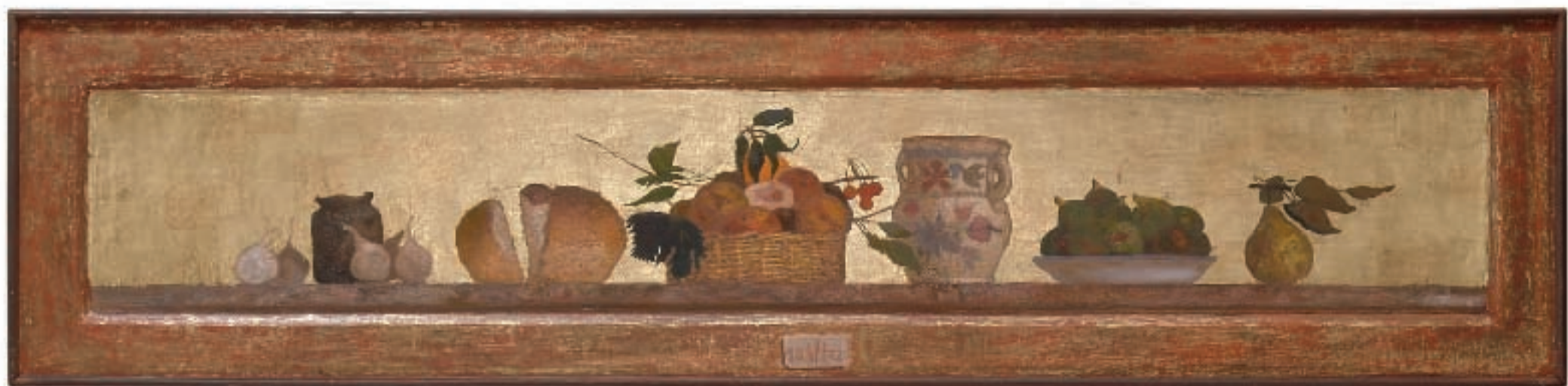
СУТОН, уљане боје на дасци, шлаг метал, 148x34 цм, 2002 / DUSK, oil on board, metal leaf