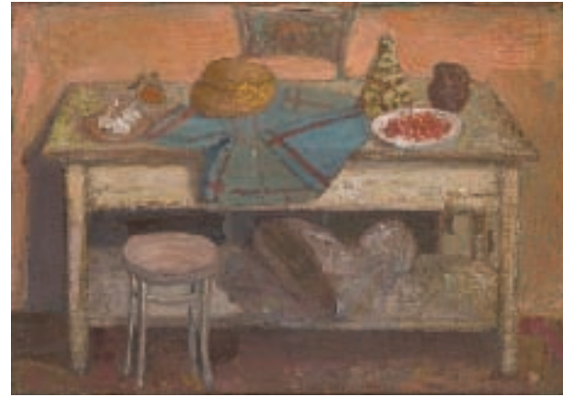
СТО, уљане боје на дасци, 31x24,5 цм / TABLE, oil on board