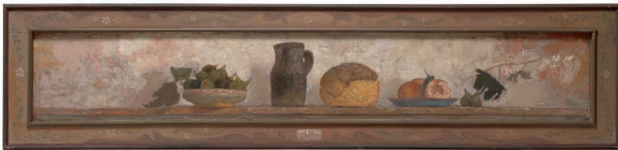
JUTRO, уљане боје на дасци, шлаг метал, 148x34 цм, 2002 / MORNING, oil on board, metal leaf