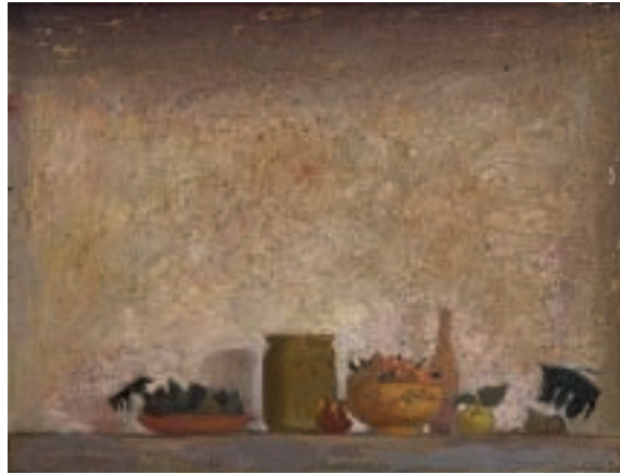
ПРЕДМЕТИ, уљане боје на дасци, 28x21 цм / ОБЈЕКТС, oil on board

Now Marina Nakićenović approached large formats and even more complex sights, while her painting not only didn't loose any of the previous freshness, certainty and beauty, but also received a new quality of intimate monumentality. An almost monochromatic tone scale with chords of orange, green and wine-red seems splendid here, for the color radiating from the hypersensitive, vibrant tissue of the sensuous facture pictorial substance matured to fermentation in Nakićenović's work. Everything in this painting was subject to pure painting structures, strict spatial discipline and aesthetic cultivatedness, calling upon something of the Zurbaran's and Chardin's refinement and classic rank of dignity. The methodical