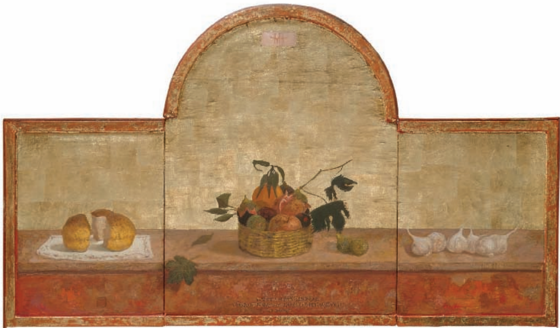
ТИХИ ЖИВОТ СА КАРАВАЂОВИМ ЛИСТОМ, уљане боје на дасци, шлаг метал, 124x46/75, триптих, 2002 / SILENT LIFE WITH CARAVAGGIO'S LEAF, oil on board, metal leaf