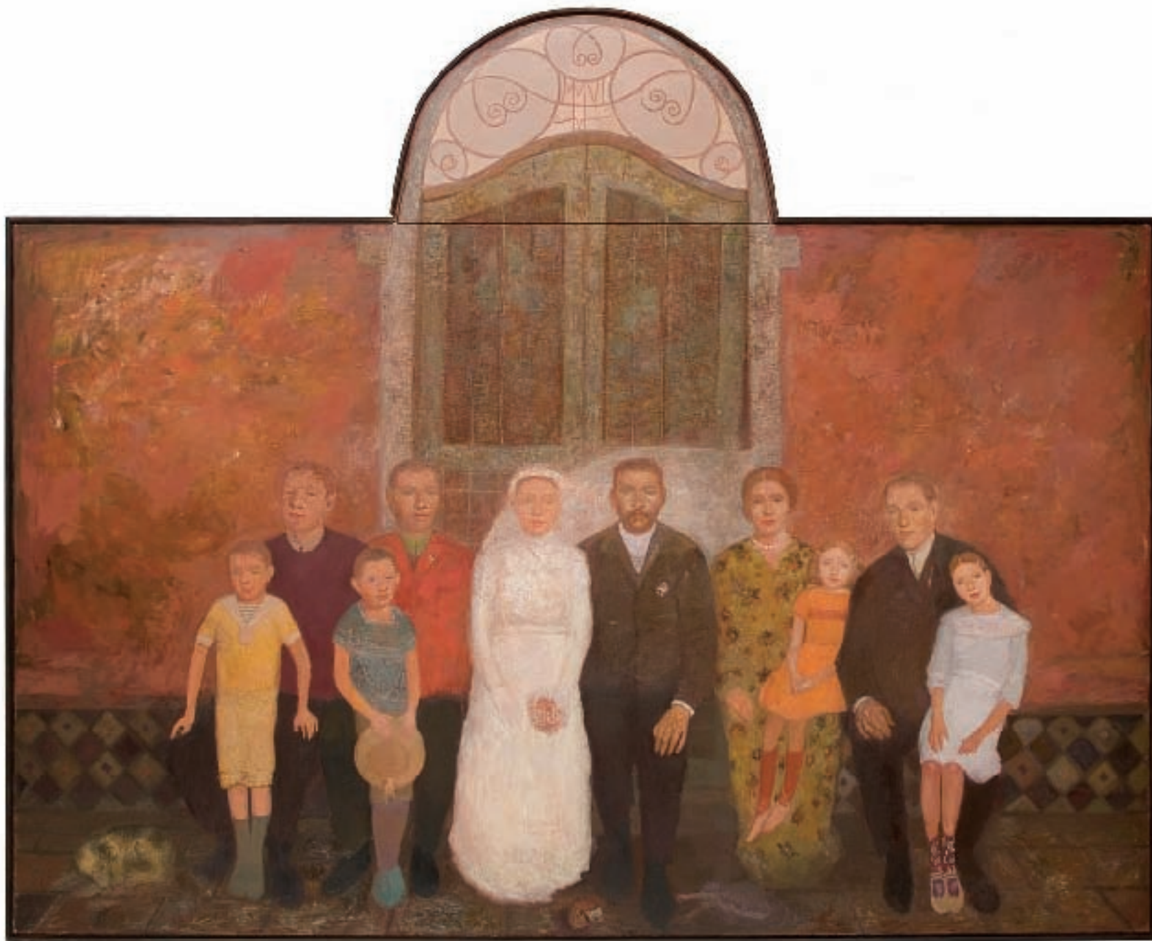
ЛУТКЕ, уљане боје на платну, 233x146, 188 цм, 2006 / DOLLS, oil on canvas