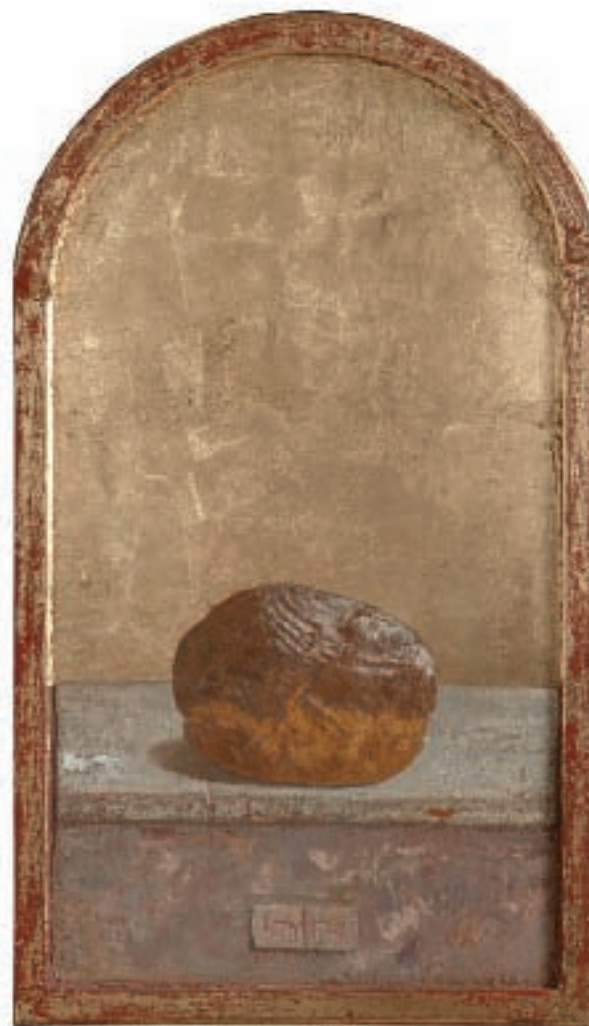
ХЛЕБ, уљане боје на дасци, шлаг метал, 35x60 цм, 2001 / BREAD, oil on board, metal leaf