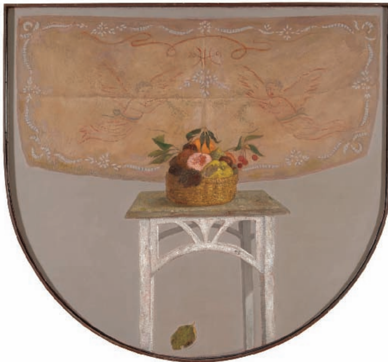
ШУМ ЊЕГОВИХ КРИЛА, уљане боје на дасци, 88X82 цм, 2001 / THE MURMUR OF THEIR WINGS, oil on board