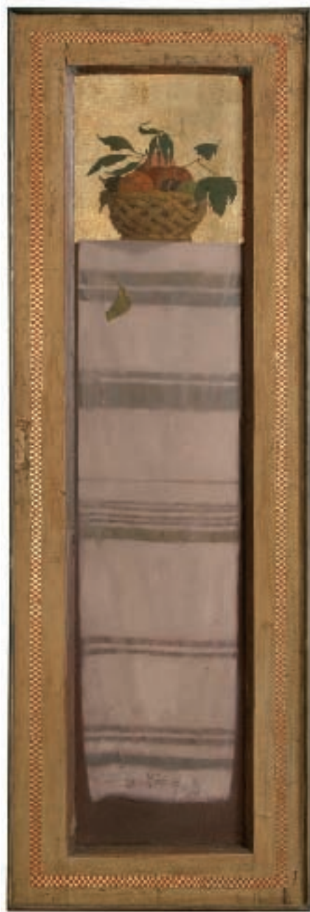
КОРПА СА ТКАНИЦОМ, уљане боје на дасци, шлаг метал, 157X50 цм, 2003 / THE BASKET WITH THE HAND WOVEN BELT, oil on board, metal leaf