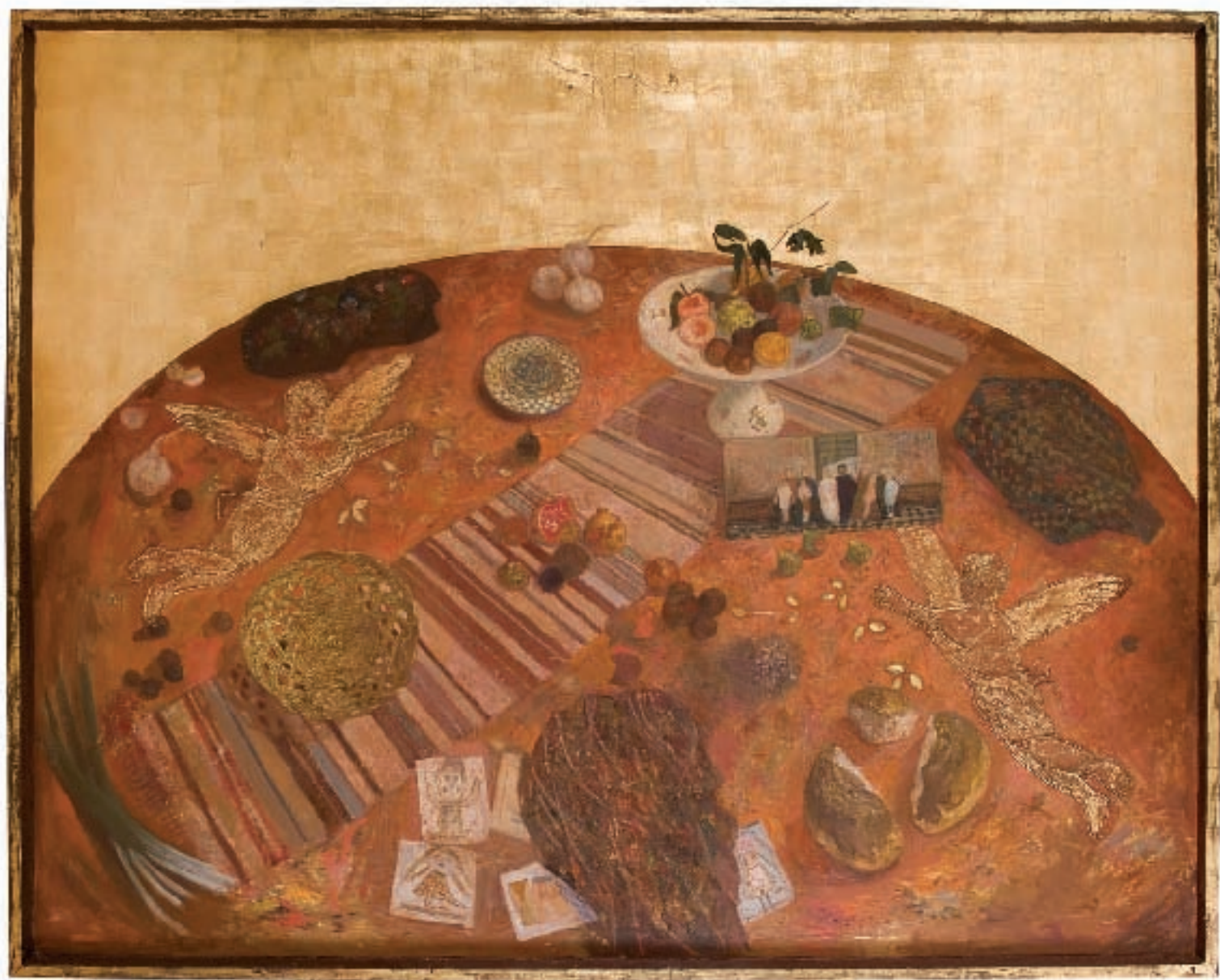
НЕДЕЉА, уљане боје на дасци, шлаг метал, 230X183 цм, 2006 / SUNDAY, oil on canvas, board, metal leaf