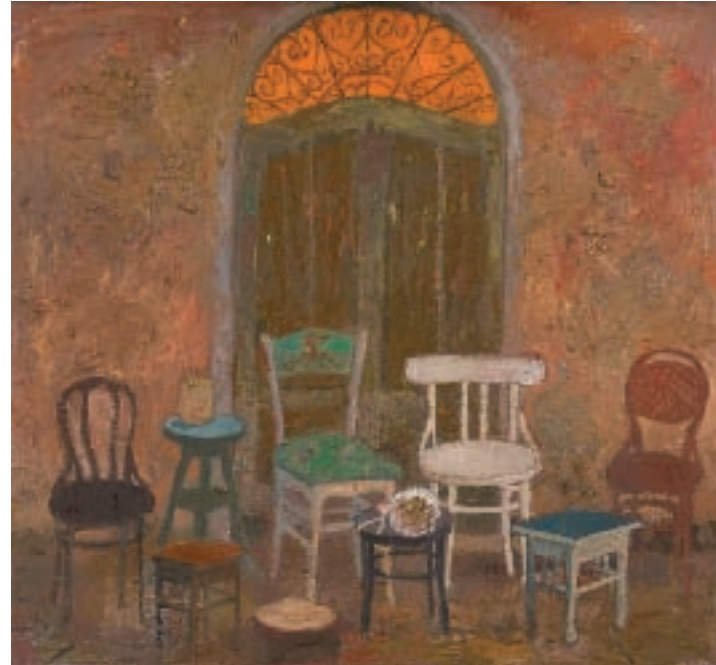
СТОЛИЦЕ, уљане боје на дасци, 42x40 цм, 2007 / CHAIRS, oil on board