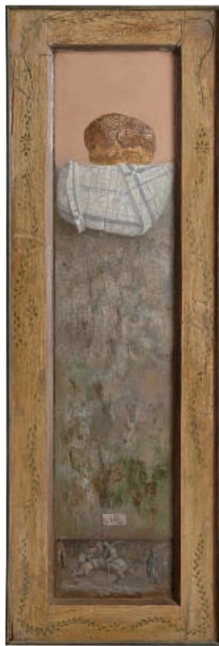
ХЛЕБ И СВ. ЂОРЂЕ, уљане боје на платну, 157X50 цм, 2002 / BREAD WITH ST. GEORGE, oil on board