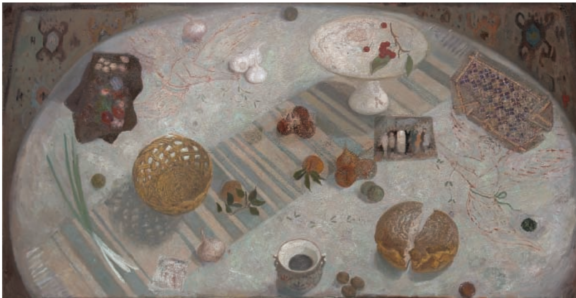
АНЂЕО ЗА МОЈИМ СТОЛОМ, уљане боје на платну, 168x86 цм, 2003 / ANGEL AT MY TABLE, oil on canvas