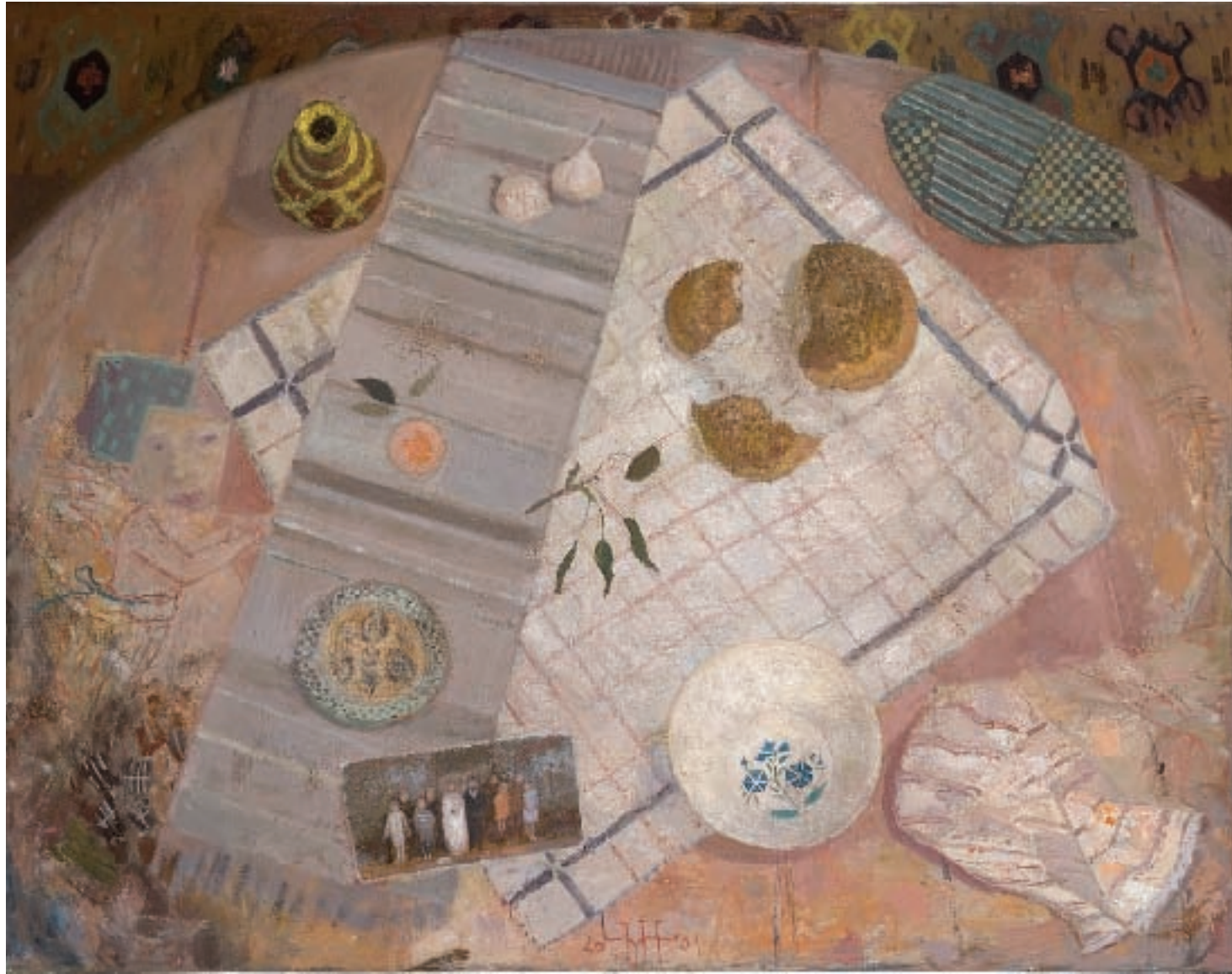
ЛИЦЕ, уљане боје на платну, 140x114 цм, 2004 / FACE, 2004, oil on canvas