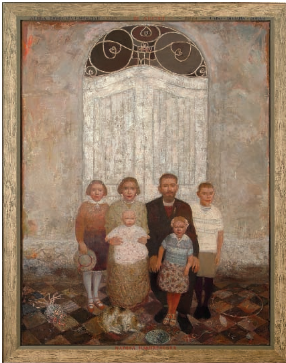
28. АВГУСТ, уљане боје на платну, 168X87 цм, 2003/4 / AUGUST 28, oil on canvas