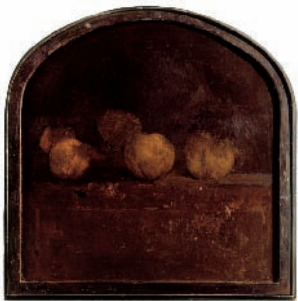
ДУЊЕ, 1999, уље на дасци, 36x36,5 цм / QUINCES, oil on board