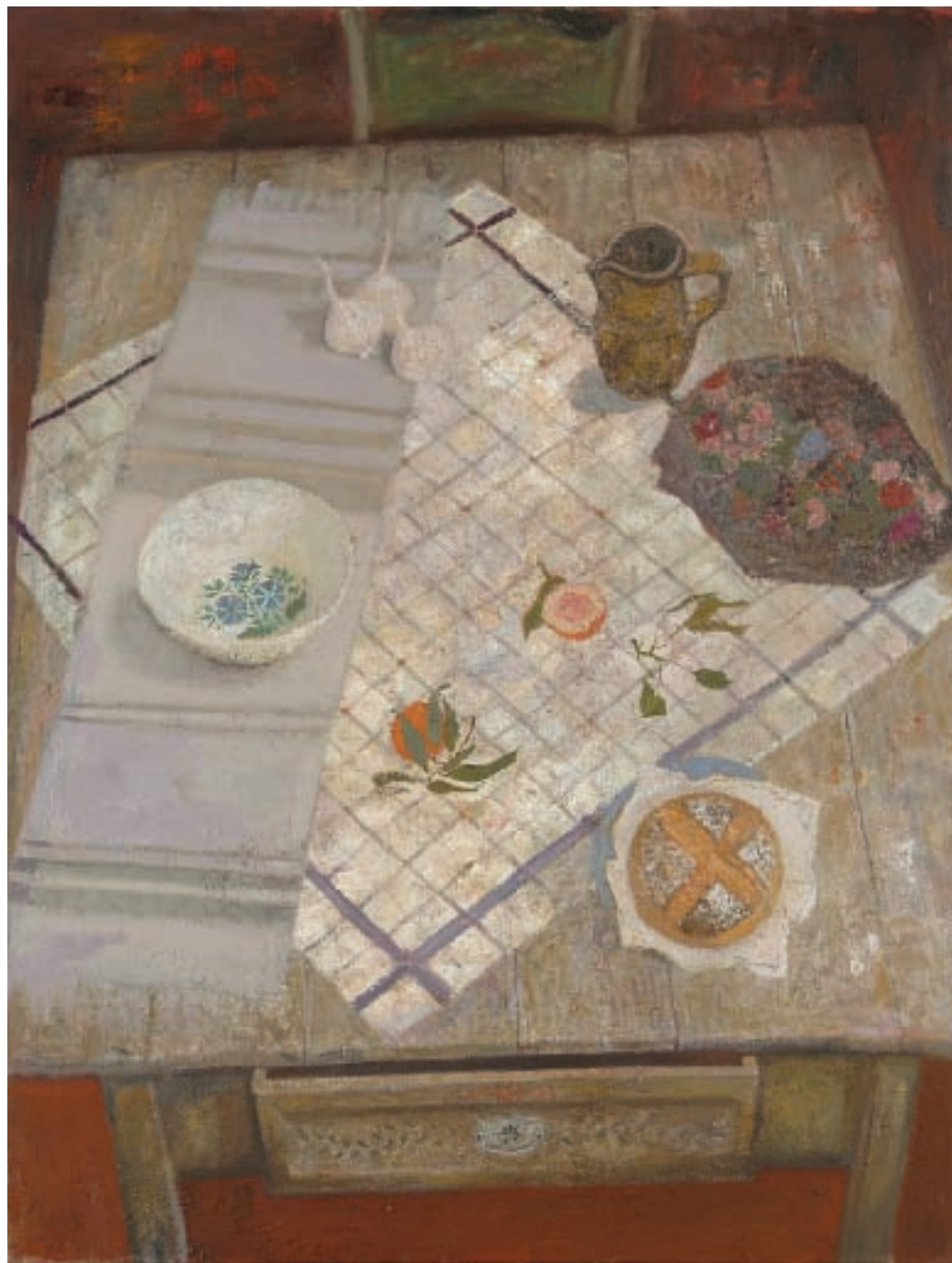
ЋУП, ЧИНИЈА И ХЛЕБ, уљане боје на платну, 114x100 цм, 2003 / JUG, BOWL AND BREAD, oil on canvas