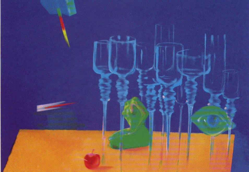
Lilit među čašama

„I stvori Bog čovjeka po obličju svojemu, po obličju Božijem stvori ga; muško i žensko stvori ih.“