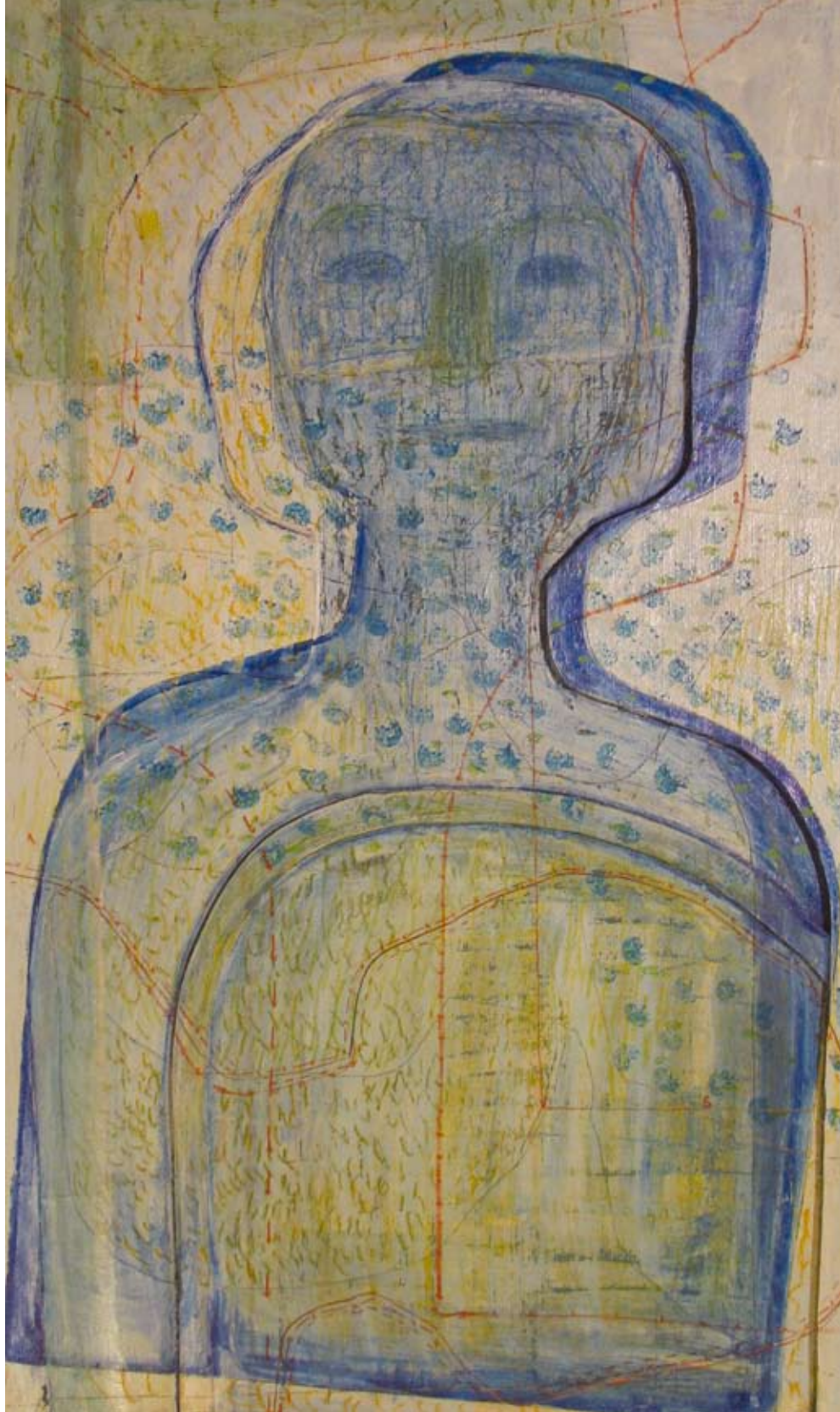
Наташа комбинирана техника