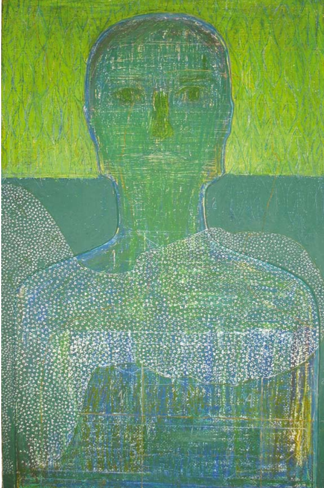
Данијела КОМБИНОВАНА ТЕХНИКА